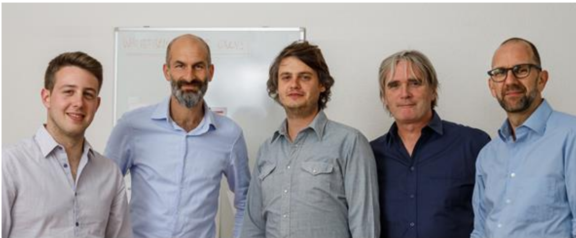
Das Beratungsteam des mannebüro züri

Für die Zahlen und Statistiken ist dazu ein separates PDF erstellt worden. Wir freuen uns, wenn Sie sich Zeit nehmen, unsere neuen Dokumentationen anzuschauen.