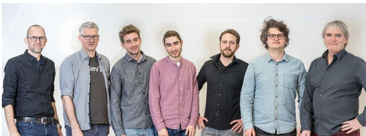
Das Beratungsteam des mannebüro züri 2020

Das mannebüro züri wird vor allem von Selbstmeldern aufgesucht . Für die Finanzierung dieser Beratungen wird von den Männern ein finanzieller Beitrag von 1% ihres Nettolohns (z.B. Einkommen Fr. 4000.-- = Fr. 40.-- pro Beratungsstunde) erwartet. Da dies unsere Kosten nicht zu decken vermag, es uns aber ein Anliegen ist, auch Männer in finanziellen Schwierigkeiten oder ohne Einkommen beraten zu können, erwirtschaftet das mannebüro züri jährlich ein Defizit, das wir mit Spenden sowie Gönner- und Mitgliederbeiträgen zu decken versuchen .