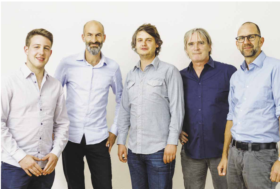
Das Beratungsteam 2018

Das mannebüro züri ist auf finanzielle Unterstützung von Dritten angewiesen. Neben dem Kanton und der Stadt Zürich unterstützen uns unsere Mitglieder sowie Gemeinden, Stiftungen oder Genossenschaften.