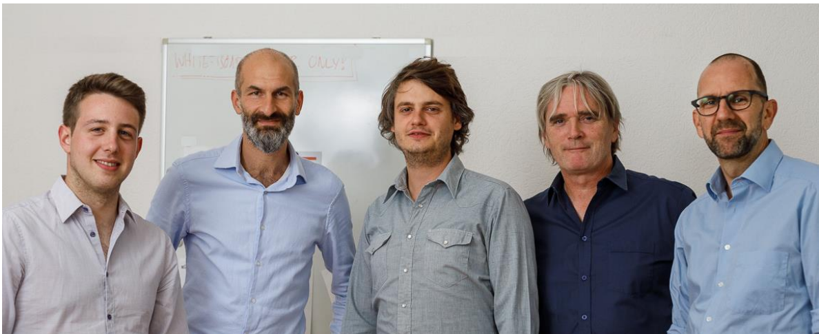
Das Beratungsteam des mannebüro züri

Das mannebüro züri hat in diesen Bereichen klassische Männerthemen fortlaufend aufgenommen und ratsuchenden Männern ein entsprechendes Angebot zur Verfügung gestellt. Diese Tradition, sich aktuellen Männerthemen zuzuwenden, will das mannebüro züri weiterhin pflegen.